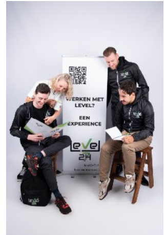
Vaste gezichten met onderwijsachtergrond

Gezamenlijk met de school worden de processen regelmatig geëvalueerd en aangepast met als doel een duurzame samenwerking te beogen.